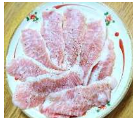
▲森町産SPF豚トントロ

※お肉本来の味をご堪能いただきたくため、タレ漬けしていないお肉でご提供しておりますが、モミダレもご用意できますのでご希望の方は遠慮なくお申し付け下さい。